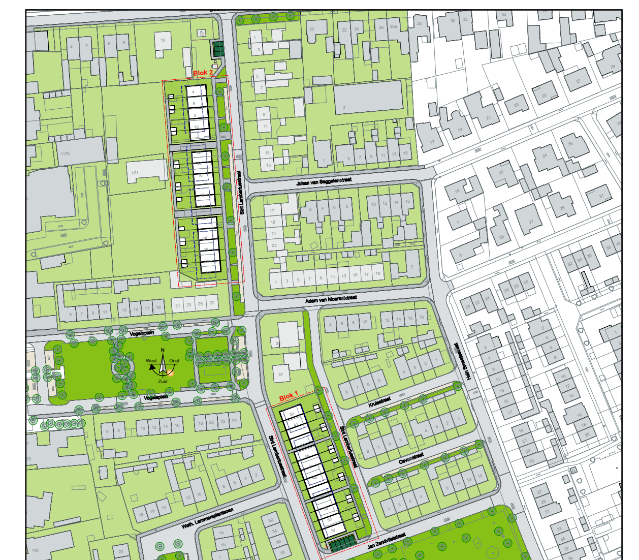
Blok 1 Situatie Nieuw 1:200